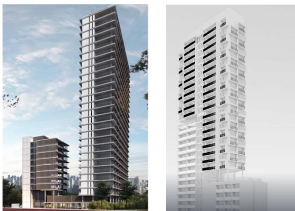
Imagens meramente ilustrativas dos projetos Estilo Barroco e Pássaros e Flores, respectivamente.

Em decorrência da Transação, o Fundo fará jus ao recebimento do valor correspondente a um percentual do valor geral de vendas líquido do empreendimento imobiliário advindo da comercialização de suas futuras unidades autônomas.